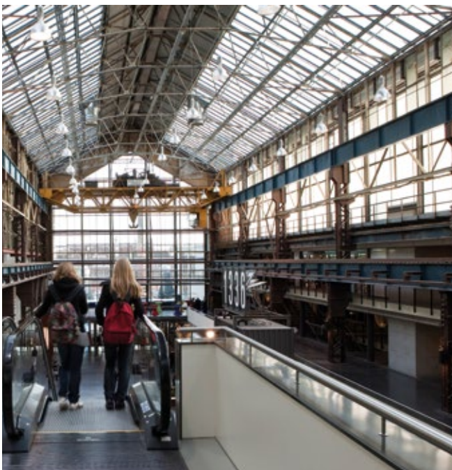
Eén van de hallen van de voormalige gieterij van Stork is geïntegreerd in de nieuwbouw van het ROC Oost-Nederland.

Bij de verdeling van het beschikbare budget krijgen eigenaren voorrang boven belanghebbenden. Als binnen een van deze groepen een nadere selectie moet plaatsvinden, krijgen 'Professionele organisaties voor monumentenbehoud' voorrang. Deze organisaties zijn op grond van de Subsidieregeling instandhouding monumenten aangewezen. Mocht dan nog een nadere selectie nodig zijn, dan gaan de plannen met de laagste kosten voor.