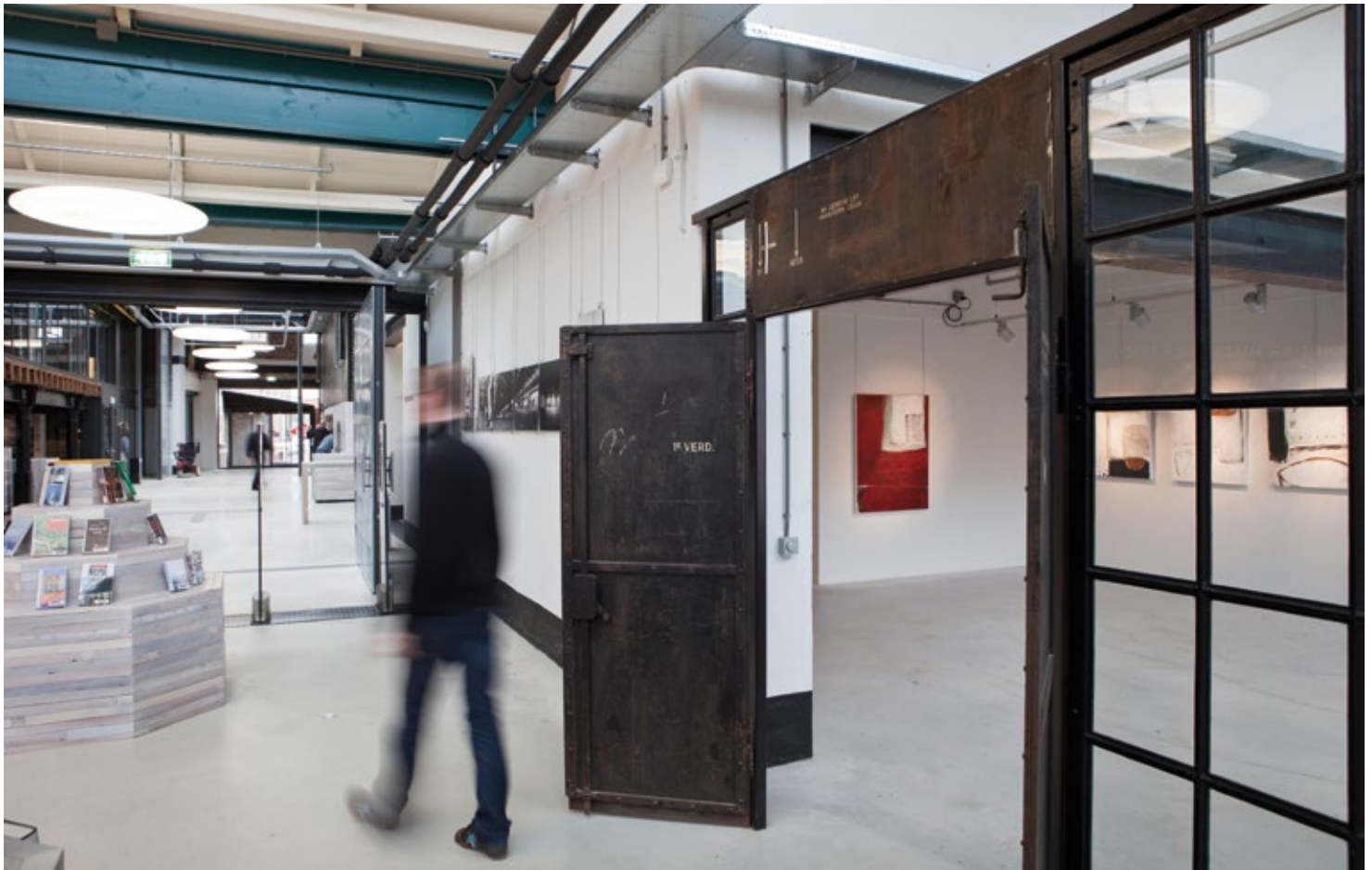
In de voormalige ijzergieterij DRU in Ulft zijn nu onder andere een bibliotheek, een grand café en een theater gevestigd.

Als sprake is van een samenhangend complex, zoals een klooster met meerdere gebouwen of een fabrieksterrein, kunnen voor dat complex maximaal twee subsidieaanvragen worden ingediend. Elk van deze aanvragen kan één of meer gebouwen of zelfstandige onderdelen omvatten. Per aanvraag gelden de hierboven genoemde maximum- en minimumbedragen.