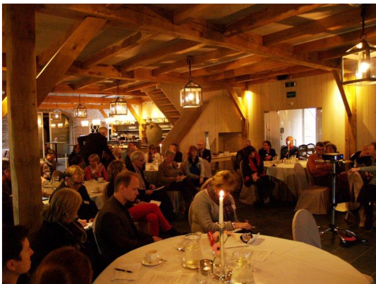
Bijeenkomst Groen Erfgoed Drenthe

Landschappelijk inpassingen moeten worden uitgevoerd wanneer bouw in strijd is met inrichtingsplannen. Men heeft vaak nog niet door wat landschappelijke inpassing is en controles worden niet uitgevoerd. Kijken naar andere gemeenten kan helpen bij het oppakken van de controles.