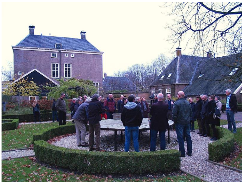
Buitenexcursie – tuin van de Havixhorst